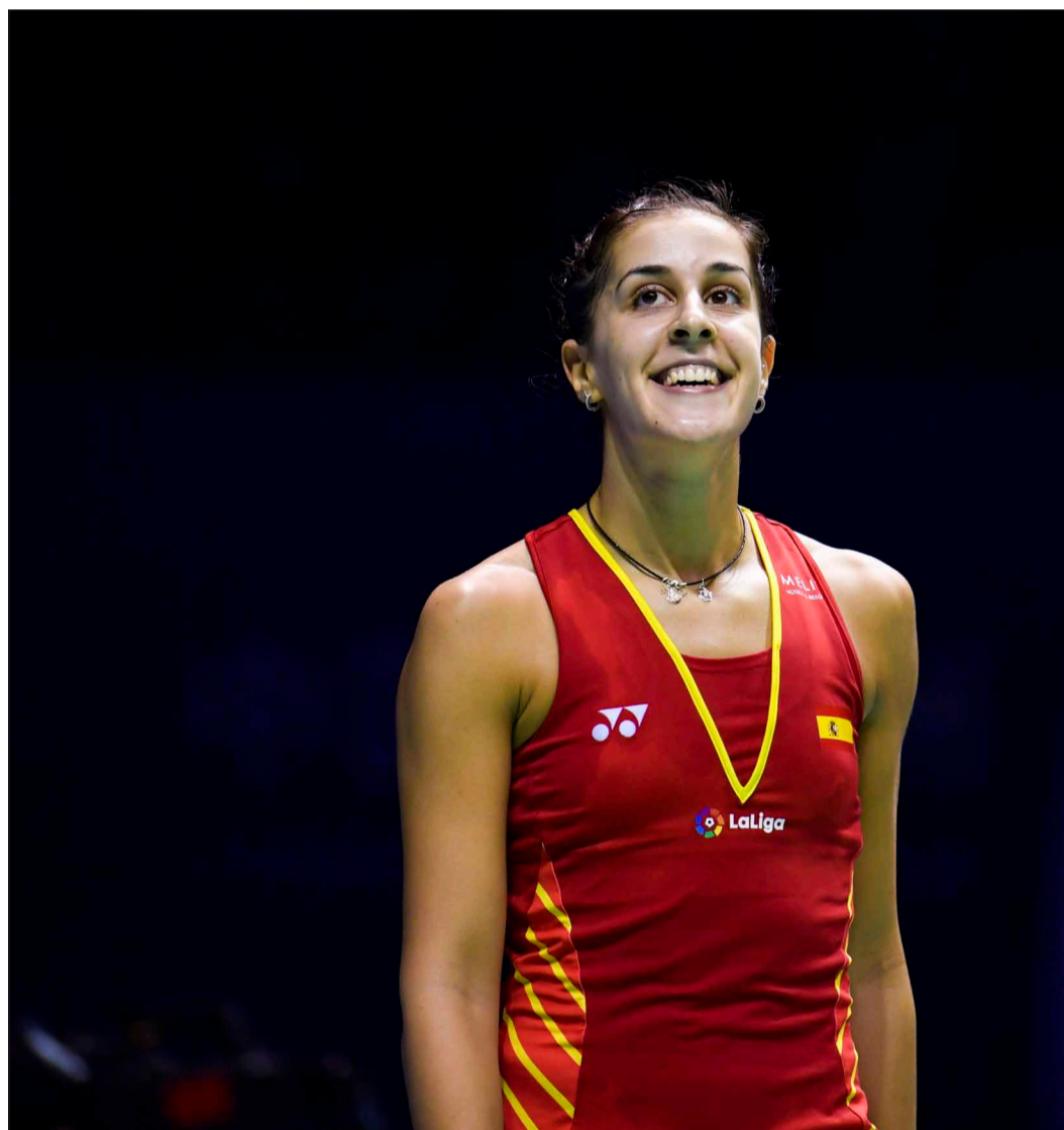
SONRISA. La onubense Carolina Marín volvió a conquistar China y a hacer mucha historia.